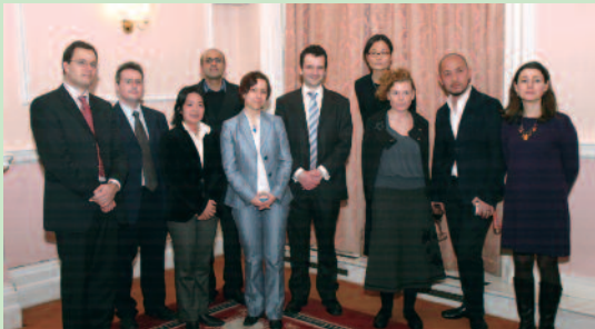
Sasakawa Lecturers at Embassy Reception