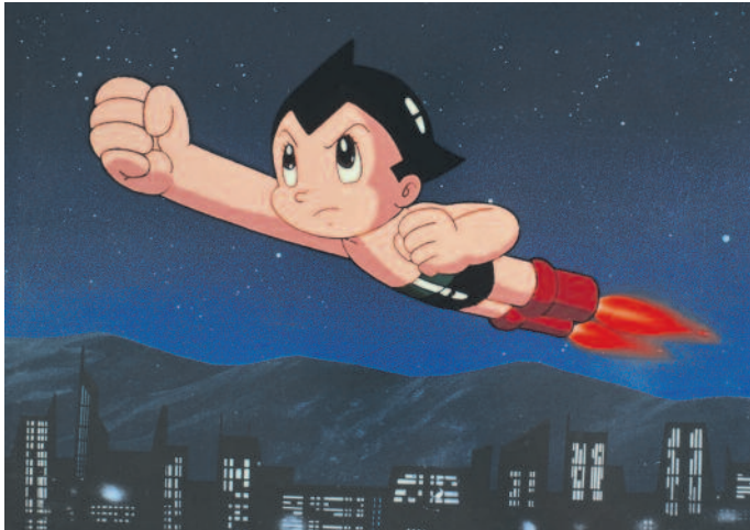
Osamu Tezuka's most recognised and beloved character Astroboy.