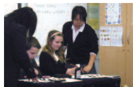
A visiting Osaka student shows a pupil from Belvedere School, Shrewsbury how to do Japanese calligraphy.