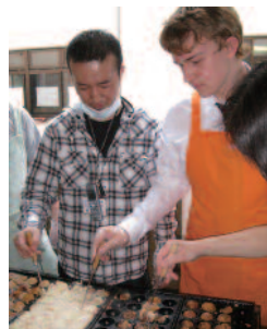
Learning to cook tako-yaki. Twelve students from Charles Burrell School in Thetford participated in the Japan Experience Study Tour 2008, experiencing life in Japan through the mediums of history, religion, culture and social inclusion. During their trip they visited an elderly care home in Kyoto and helped make tako-yaki for the home's residents.